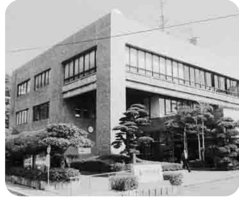
香焼行政センター