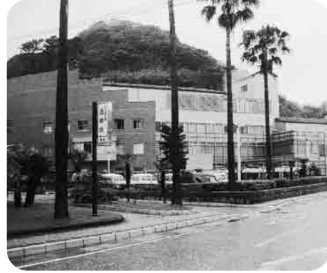
高島行政センター