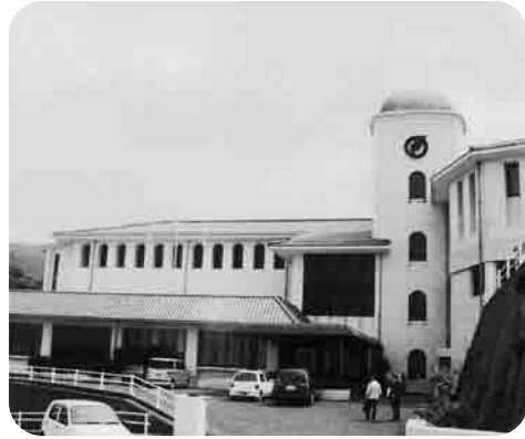
外海行政センター