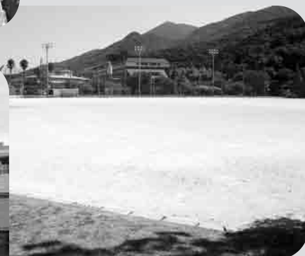
元宮公園(三和町・運動場)