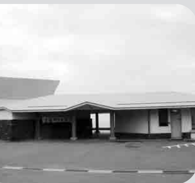
長崎市遠藤周作文学館(外海町)