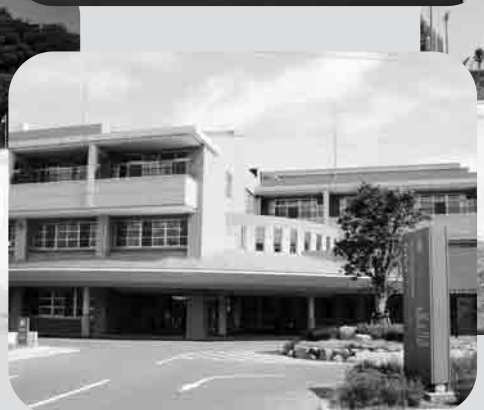
▲長崎市立野母崎病院(野母崎町)