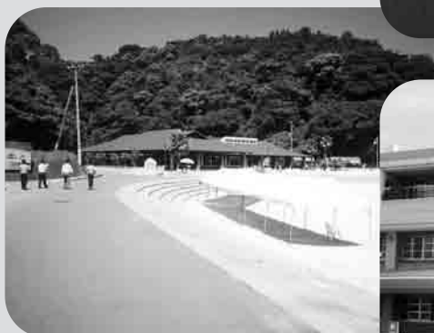
長崎市伊王島海水浴場交流施設 (伊王島町)