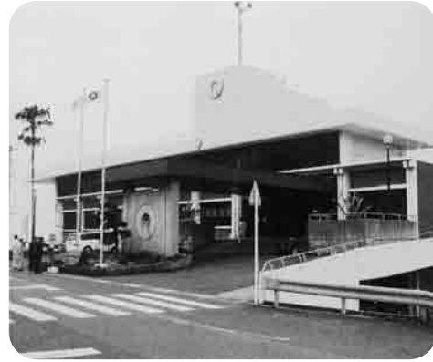
野母崎行政センター

9月議会 は 合併条例を審議 来年1月4日に1市6町が合併して、新長崎市が誕生します。9月定例会市議会では、合併に関連する補正予算及び各町の公の施設に関する条例などの議案を主に審議しました。 平成の大合併と言われるように、議会でも史上初めてといえる膨大な議案が提出され、各常任委員会の自主的調査を加えると1ヶ月余りの審議となりましたが、各議案とも原案通り可決され、新長崎市誕生への基盤が整いました。 今後は、合併までに施設の運用や各種制度など、各町住民の意見を十分尊重し、市と町の行政間で調整を図りあって決定し、皆さんに不安を与えないようなきめ細やかな対応が必要です。 合併後、新長崎市民皆さん一人ひとりが『お互いに合併してよかった』言い合えるよう、安心して住みよい街づくりを皆様と共に創って行きましょう。