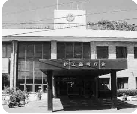
伊王島行政センター