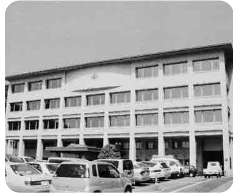
三和行政センター