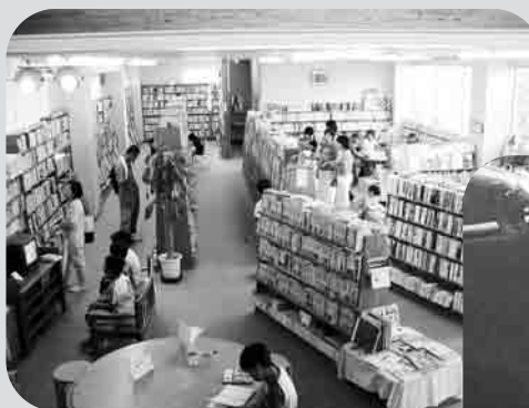
長崎市香焼図書館(香焼町)