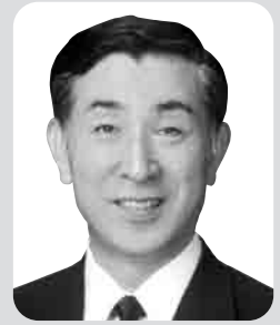
衆議院議員 高木義明