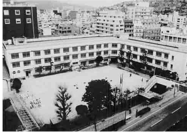
解体が決定した旧新興善小学校