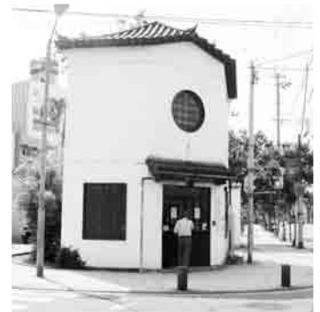
(写真は旧湊公園交番) 【対象交番】 旧湊公園交番・旧茂木町駐在所

事業費：150万円 廃止交番・駐在所を、地元自治会等のコミュニティ及び安全・安心の活動拠点として整備する。