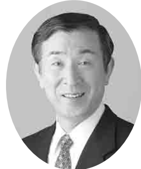
衆議院議員 高木 義明