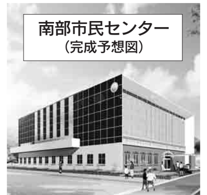
期間：平成19年度～平成21年度