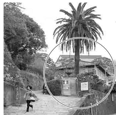
オランダ坂に建つ東山手13番館

事業費：1億92万6千円 東山手伝統的建物群保存地区内の東山手13番館を取得する。