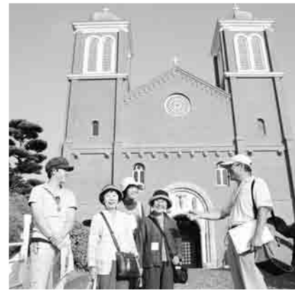
「長崎さるく」は平成19年4月からスタート

事業費：1200万円 長崎さるく博で培った人材やノウハウを活かし「さるく観光」を継続・発展させるため、平成19年4月からスタートする「長崎さるく」のポスター・チラシの作成やガイドステーションの装飾、さるくコースの植栽植替え等を行う。