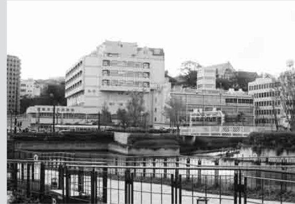
現在地に建替えが決まった市民病院

平成22年着工 平成27年度完成予定 新病院のと建設費(用地買収含む)は約220億円で、財源は合併特例債などを充てます。新しく取得する土地約4600平方メートルに地下一階、地上七階の建物を造り、現在地は駐車場となります。現在のようには地域医療支援病院の機能を持たせ、病床数は450床を計画。民間では不採算とされる救急や周産期医療を充実させていきます。