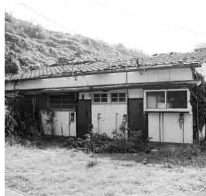
老朽化で取り壊される香焼町堀切西団地市営住宅