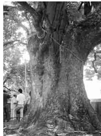
山王神社の大クス