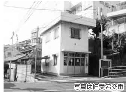
写真は旧愛宕交番

本年4月に統合廃止された交番、駐在所6ヶ所を、自治会等のコミュニティ及び安全・安心の活動拠点として整備し、自治会等に貸し付け、地域住民の連携及び安全・安心まちづくりの推進を図る。