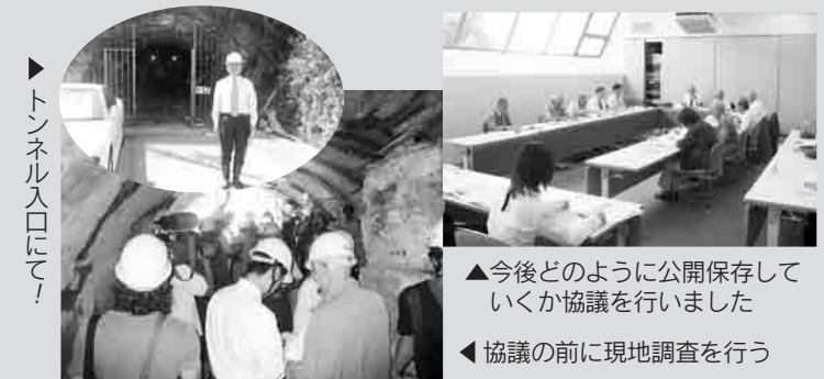
トンネル入口にて!