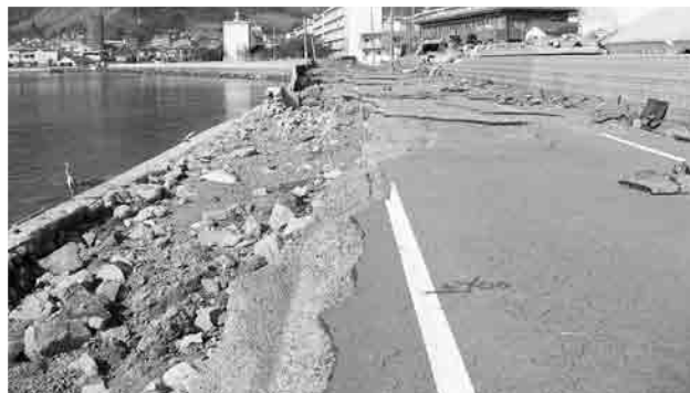
崩壊した田中町の堤防と市道

主な内容は、小・中学校災害復旧費合計4,600万円、観光施設等災害復旧費3,950万円、土木費1億8,400万円、道路災害復旧費6,000万円、災害廃棄物処理費1,700万円などです。