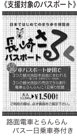
路面電車とらんらんバス一日乗車券付き

●1日共通乗車券推進費(新)……100万円 市民及び観光客の利便性向上と公共交通機関の利用促進を図るため、市内一定区間における電車及びバスの1日共通乗車券の導入を支援する。