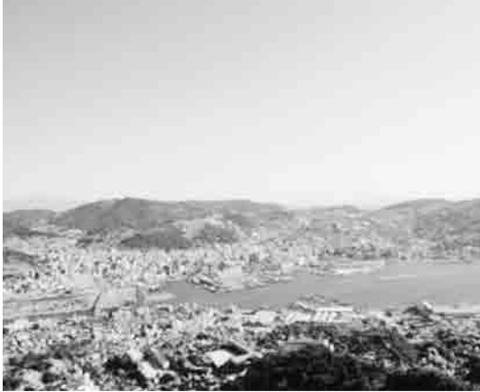
老朽危険空き家が点在する長崎市の斜面地域

●安全・安心住まいづくり支援事業費(新)……3,556万円 旧耐震基準により建築された木造住宅について、耐震診断費や耐震改修工事費の一部を助成する。