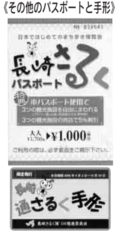
《その他のパスポートと手形》

●観光2006アクションプラン推進事業費……6億1,954万4千円 (1)観光ガイド育成サポート事業費……320万円 (2)長崎さるく博06イベント費……3億5,980万円 グラバー園、出島、中島川などの会場イベントや、長崎のまちを歩き